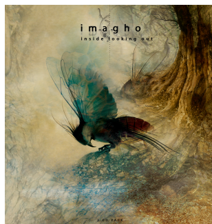
« ..très accessible et subtil, savant mais humble, fréquemment poignant. Quelque part entre le Marc Ribot des jours paisibles, les plages les plus oniriques de Gary Lucas et la mélancolie sourde de The Durutti Column » MAGIC Mai 2008