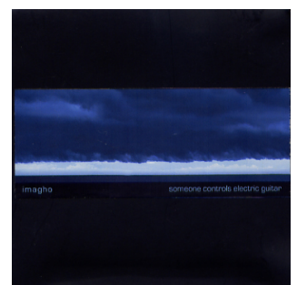
« un nouveau témoignage de ces expériences où le musicien élève ces bruits que d'autres fuient (craquements, tremblements fragiles) au rang d'intervenants nobles... » FEAR DROP #12, JUIN 2005